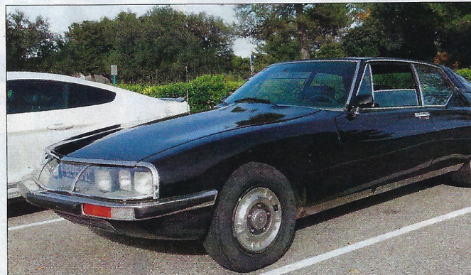
▲ Le noir est une couleur rarement demandée sur la Citroën SM. Cette teinte, disponible entre 1972 et 1974, était la seule pouvant être associée à toutes les teintes intérieures disponibles (cuir, skai ou tissu).